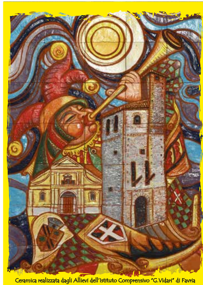
Ceramica realizzata dagli Allievi dell'Istituto Comprensivo "G. Vidari" di Favria